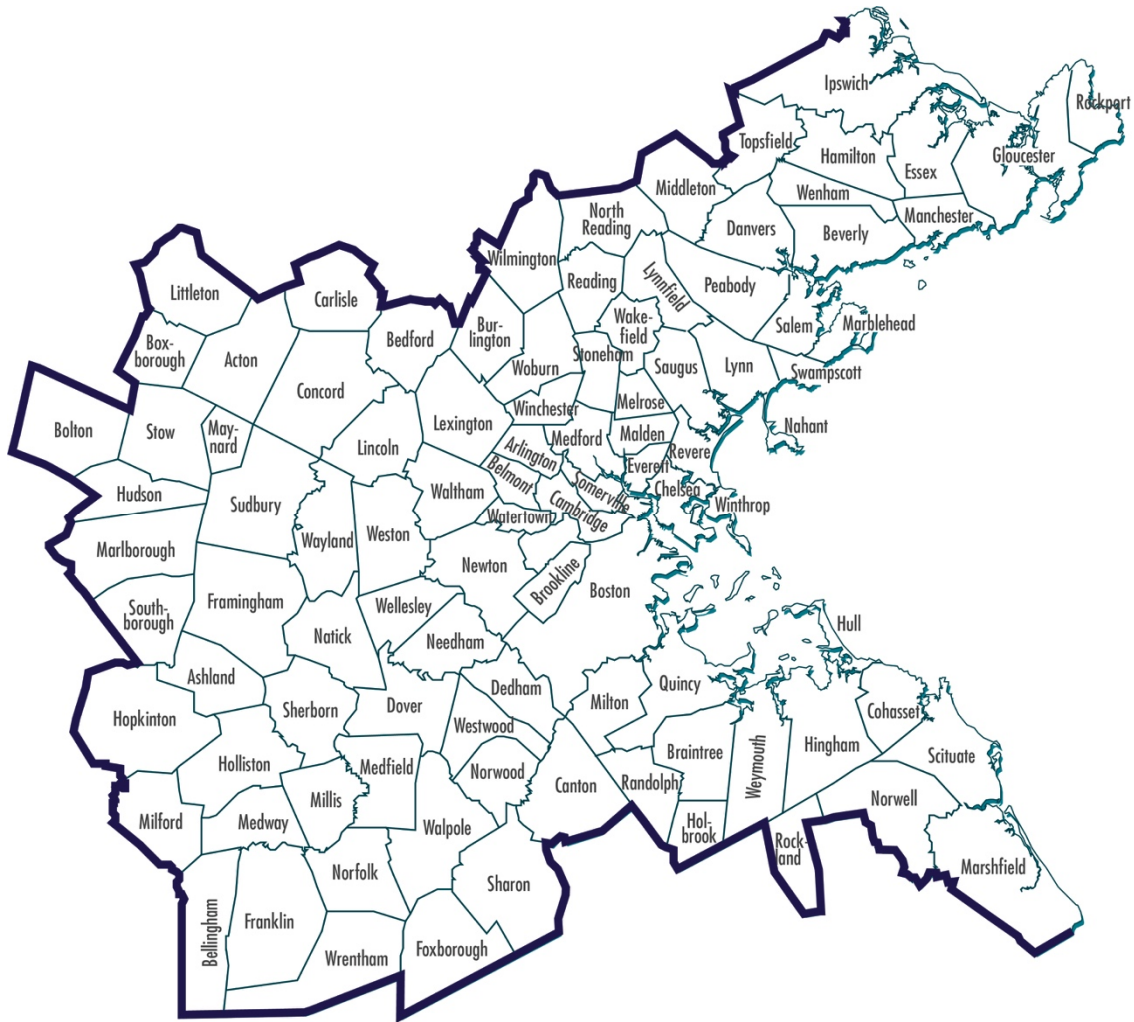
Figura ES-1 Municípios da região de Boston

O conselho da MPO é composto por 22 membros votantes. Várias agências estaduais, organizações regionais e a cidade de Boston são membros permanentes votantes, enquanto 12 municípios são eleitos como membros votantes por períodos de três anos. Oito membros municipais representam cada uma das oito subregiões da região de Boston e há quatro sedes municipais gerais. A Administração Rodoviária Federal (FHWA) e a Administração de Trânsito Federal (FTA) participam da diretoria da MPO como membros consultivos (sem direito a voto). Mais detalhes sobre os membros permanentes da MPO constam no Anexo F .