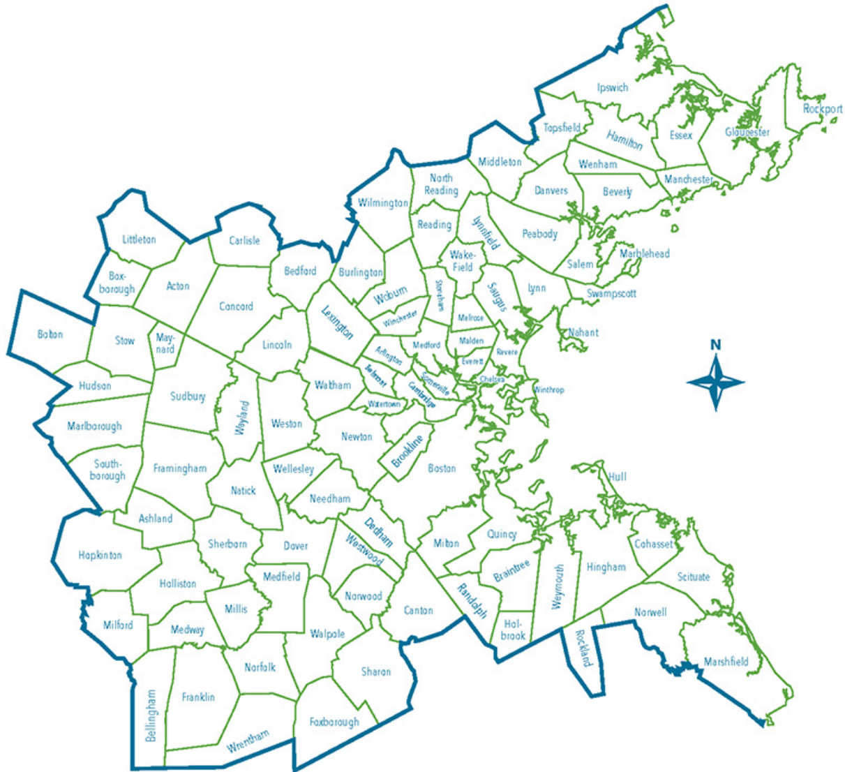
BOSTON REGION METROPOLITAN PLANNING ORGANIZATION MUNICIPALITIES